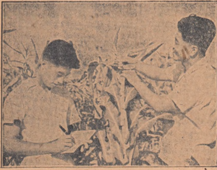
Mii de absolvenți ai Institutului Agronomic din Pekin lucrează astăzi în satele Chinei Populare, îndrumând pe țărani chinezi să-și lucreze ogrorul după cele mai avansate metode agrotehnice.