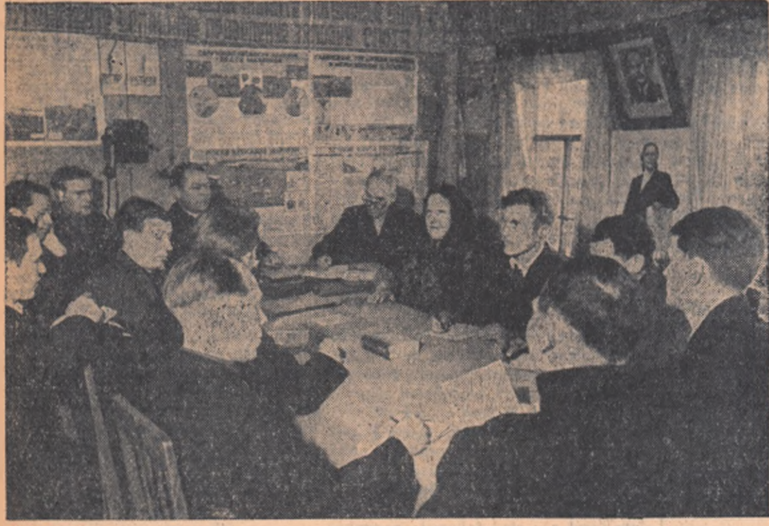
O constătutare a conducerii colhozului „Obnovlenie” din R.S.S.A. Mordvină.