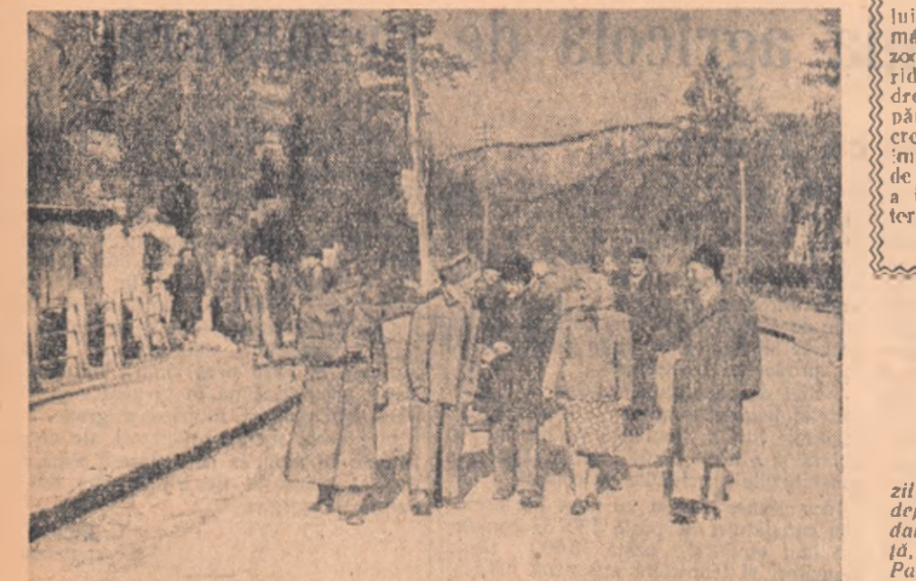
În stațiune, prietenii se leagă repede. Un grup de muncitorii agricoli din diferite regiuni ale țării în plimbare pe malul Otului.

...Și cum vă spusese, de la o vreme simțeam că nu-i a bună cu mine. După fiecare masă, dureau: M-am dus la doctorul de la policlinică. Raze, una alta, mă rog, ca la doctor. Numai ce-l auzi că-mi spune: