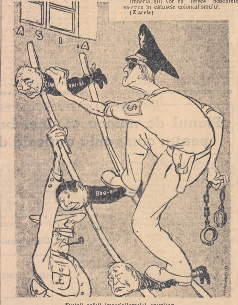
Fusteli scării Imperialismului american (Reprodus din revista Krokodil)

LONDRA 12 (Agerpres). - După cum s-a anunțat, comitetul parlamentar laburist a hotărât cu nouă voturi contra patru să-l excludă din grupul parlamentar pe Aneurin Bevan, liderul aripii de stînga laburiste și să recomande totodată Comitetului Executiv al partidului laburist excluderea lui din partid.