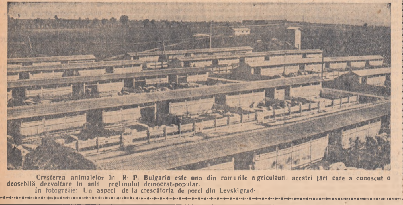
Creșterea animalelor în R. P. Bulgaria este una din ramurile agriculturii acestei țări care a cunoscut o deosebită dezvoltare în anii regimului democrat-popular. În fotografie: Un aspect de la crescătoria de porci din Levskiograd.