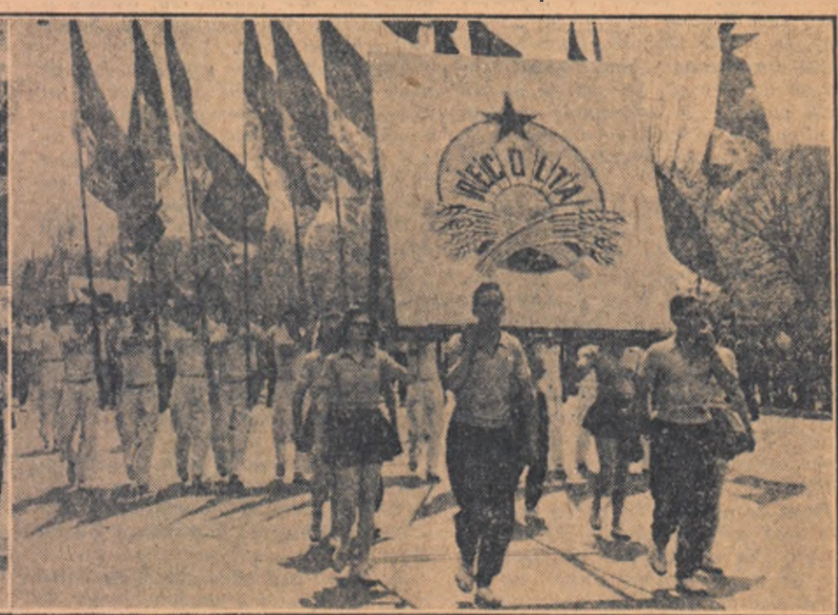
Ore în șir au trecut prin fața tribunelor: din Piața Stalin coloanele nesfîrșite ale demonstrațiilor. Ei au raportat cu mîndrie partidului și guvernului despre succesele obținute în producție și și-au manifestat hotărîrea de a lupta cu forțe spo-