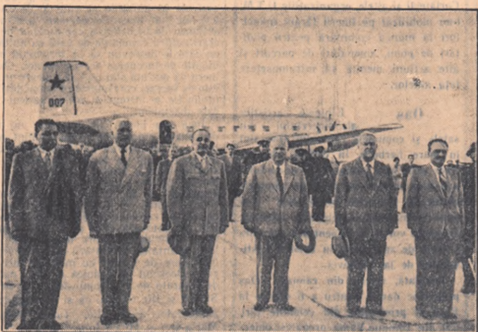
Tovarășii Gh. Apostol, dr. Petru Groza, Gh. Gheorghiu-Dej, N. S. Hrușciov, N. A. Bulganin și A. I. Mikoian pe aeroportul Băneasa.

Membrii delegației sovietice, însoțiți de conducătorii partidului și guvernului, de