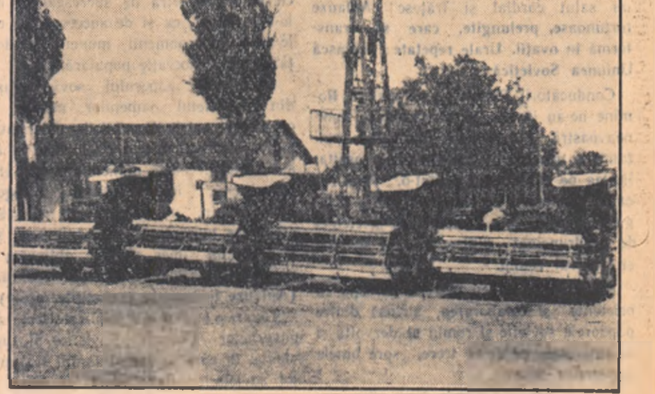
Statul nostru acordă o deosebită atenție înzestrării S.M.T.-urilor cu utilaj agricol din ce în ce mai modern. O bună parte din acest utilaj ne este trimis de Marea Uniune Sovietică.

În elșeu: Un grup de combine pentru recolta pîloase, sosite de curînd din U.R.S.S. la S.M.T. „Măi” Brăila.