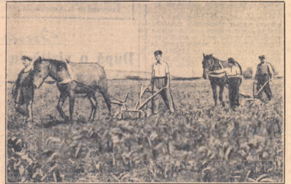
Membrii gospodăriei agricole colective „Secera și Ciocanul” din comuna Răcăciuni, raionul Bacău sînt frunțași la îngrijirea culturilor. Pînă la 21 iunie terminaseră de prășit pentru a doua oară culturile de floarea soarelui și steaia de zahăr, precum și o mare parte din culturile de cartofi.