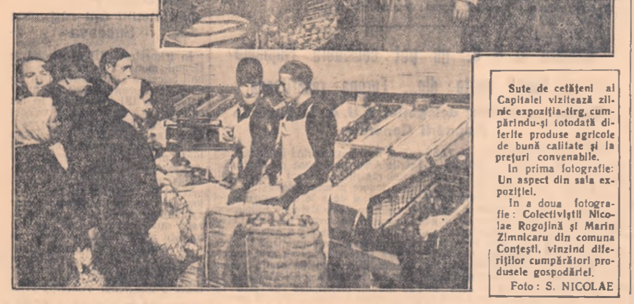
In halele Obor din Capitală, s-a deschis de curînd expoziția-tîrg a gospodăriilor colective și întovărășirilor agricole din regiunea București. Expoziția oglîndește realizările colectiviștilor și întovărășitorilor din această regiune pe tîrîmul creșterii producției agricole și a nivelului lor de trai material și cultural.