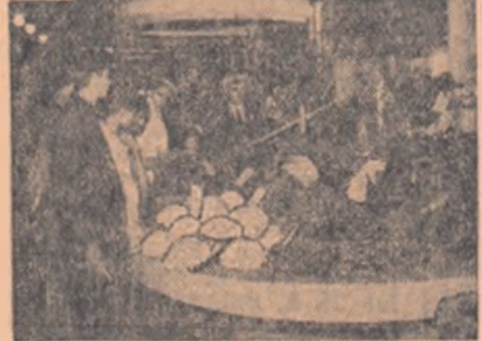
La standul gospodăriei colective din Topraisar, vizitatorii admiră mostrele de știuleți din bogata recoltă de porumb obținută anul acesta.

La începutul lunii noiembrie, a-a deschis în orașul de reședință Expoziția agricolă a regiunii Constanța.