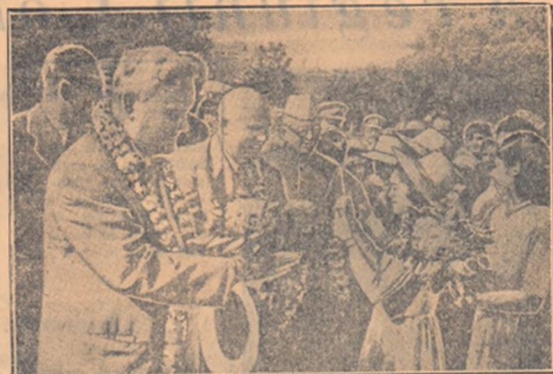
La 20 noiembrie, N. A. Bulganin și N. S. Hrușciov au vizitat străvechiul oraș indian Agra, renumit în întreaga lume pentru monumentele sale care intruchipează înalta cultură și minunata artă a poporului indian.

La ora 10 dimineața, ora locală, avionul cu care au plecat din Bangalore N. A. Bulganin, președintele Consiliului de Miniștri al U.R.S.S., și N. S. Hrușciov, membru al Prezidiului Sovietului Suprem al U.R.S.S., a aterizat pe aerodromul orașului Koimbatore — unul din centrele industriale importante din India de sud.