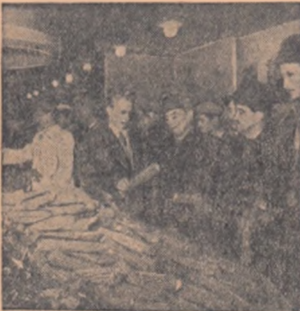
Colectivii din Palazu Mare sînt și pricepuți grădnari. Recoltele de 26.000 kg de conopidă la hectar, 26.000 kg de morcov la hectar și 30.000 kg de vinete la hectar vorbesc de la sine.