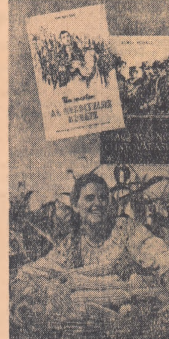
gic și cultural al oamenilor muncii de la sate, însușindu-i în lupta pentru construirea unei vieți tot mai bune.

În problema întăririi schimbului dintre oraș și sat, sînt redată în unele broșuri, cu o deosebită putere de convingere, fapte privind în-