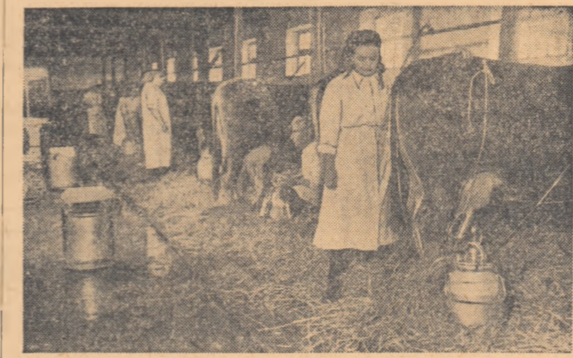
La ferma de vaci a gospodăriei agricole cooperative de muncă din Obnova, regiunea Pleven, mulsul vacilor se face cu ajutorul aparatelor de muls electrice.