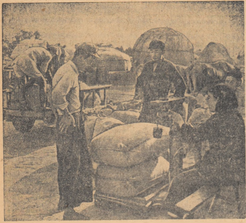
Cooperativa agricolă de producție „Știința” din provincia Anhui a obținut în anul 1955 o producție sporită de grâu. În fotografie: membrii cooperativei agricole de producție vinzând surplusul de grâu statului.