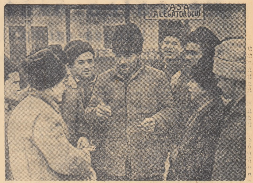
Colectivisti și țărani muncitori din comuna Urleasca, raionul Brăila, merg cu drag la Casa Alegătorului din comună, unde discută pe larg cu candidații lor diferite probleme de interes obște.