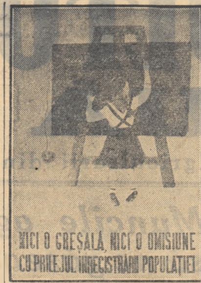
NICI O GREȘALĂ, NICI O OMIȘIUNE CU PRILEJUL ÎNREGISTRĂRII POPULAȚIEI

OAMENI AI MUNCII DE PE OGOARE! ASTAZI ÎNCEPE ÎN ÎNTREGA TARĂ RECENSĂMINTUL POPULAȚIEI. PRIMII CU ÎNCREDERE PE RECENZORI SÎN RĂSPUNDEȚI EXACT LA ÎNTREBĂRILE CE VI SE VOR PUNE NUMAI ASTFEL VETI AJUTA CA ACEASTA LUCRARE DE INTERES OBSTESC SĂ SE POATA DESFAȘURA CU SUCCES