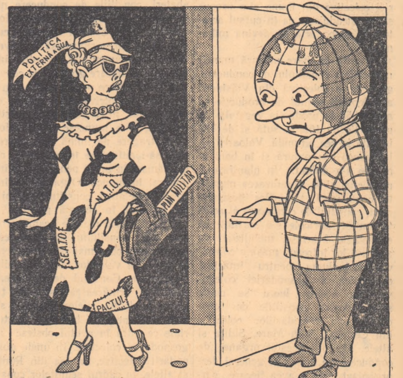
Opinia publică mondială: ar fi timpul să știi și dumneavoastră că purtați o îmbrăcăminte care nu mai e la modă.

Opinia publică mondială se pronunță cu tot mai multă hotărîre împotriva „războiului rece”, dogmă a politicii externe a S.U.A. Chiar în Statele Unite se întesesc criticile la adresa cercurilor guvernamentale și a departamentului de stat care-și reafirmă intenția de a continua și în viitor să promoveze această politică.