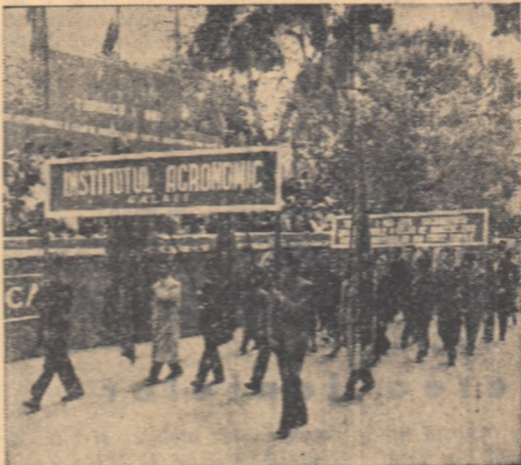
Aspecte de la demonstrația oamenilor muncii din Galați (stînga) și Iași (dreapta)