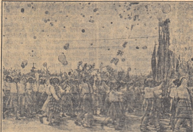
Pionieri defilând la Pekin, cu ocazia zilei de 1 Mai

Peste 600.000 oameni au participat la demonstrația în cinstea zilei de 1 Mai din Șanghai, cel mai mare oraș din China, peste 400.000 la demonstrația din Mukden, 210.000 — la Uhan, 200.000 — la Șian, cite 150.000 — la Tianjin și Dalian, 110.000 — la Canton.