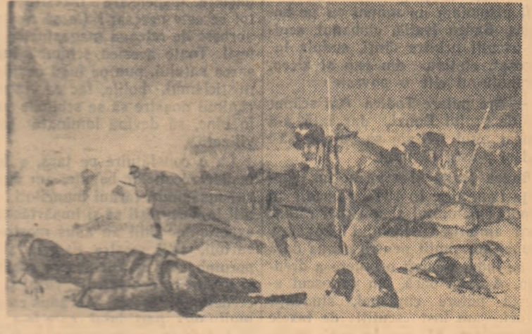
ATACUL DE LA SMÎRDAN. Reproducerea după tabloul picturii N. GRIGORESCU