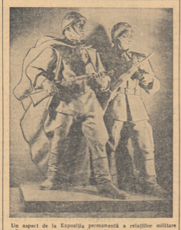
Un aspect de la Expoziția permanentă a relațiilor militare romino-ruse.

...Lung a fost drumul străbătut de ostașii sovietici de la Stalingrad și Vladicavaz pînă la Berlin. Lung și presărat de multe jertfe. În aprilie 1945, armatele frontului I belorus au pătruns, după lupte crînecne, la periferia Berlinului. La 24 aprilie 1945, se realizează, la marginea de sud-est a Berlinului, joncțiunea trupelor frontului I belorus și ale frontului I ucrainean. În biroul el, fiara fascistă își trăia ultimele clipe. Înainte de plecare, președintele a făcut o declarație pentru agențiile France Presse și Tanig.