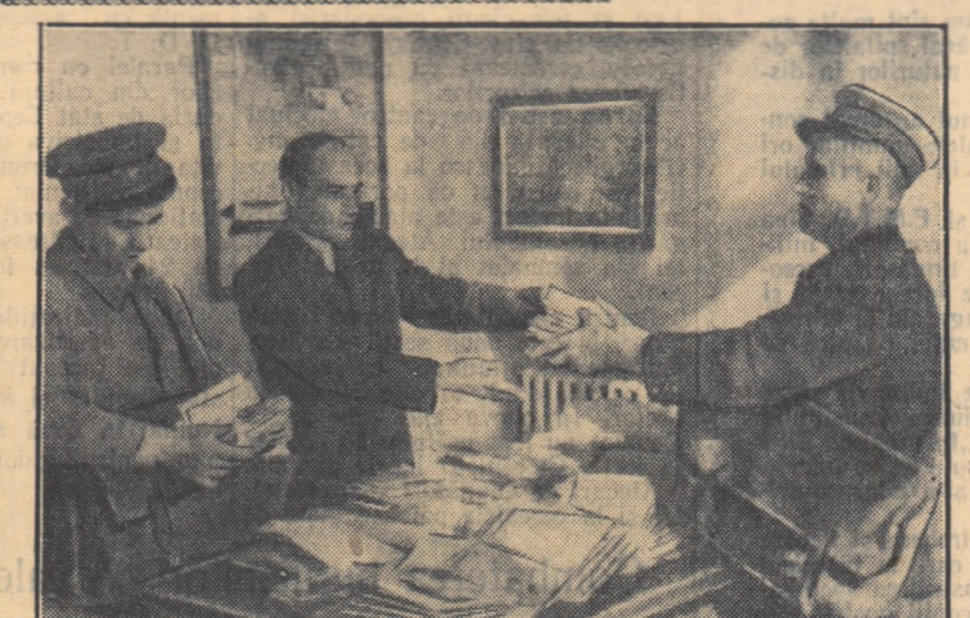
A sosit posta. La oficiul P.T.T.R. al Combinatului poligrafic „Casa Științei” vin zilnic sute și mii de scrisori, adresate de oamenii muncii din toate colțurile patriei, diferitelor publicații și ziare.