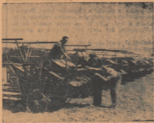
La S.M.T. Videle, inginerul mecanic și Gh. Vintilă, șeful de atelier Bucur Popescu și mecanicul controlor Ghiță Tudor, verifică aparatul de înmodare la una din cele 20 de secționări-legături ale stațiilor, care la data de 5 Iunie erau gata reparate.