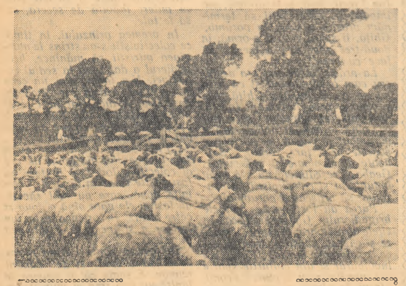
Un grup de colectiviști din regiunea Pitești și Galați vizitînd turma de oi a gospodăriei colective din comuna Bod.

Zilele trecute, o delegație, alcătuită din colectiviști, ingineri agronomi și zootehniști, medici veterinari și activiști de partid din regiunile Galați și Pitești, a vizitat gospodăriile colective din comunele Bod, Hălchiu, Hărman, Laslea și Prosteta Mare din regiunea Stalin, cu scopul de a cunoaște experiența dobîndită de aceste unități în domeniul creșterii animalelor. Ei au ascultat cu mult interes lămuririle date de către colectiviștii gazde.