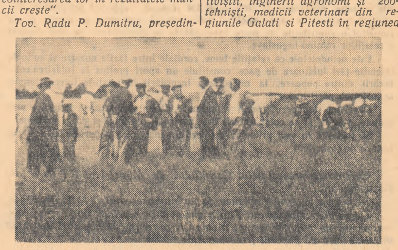
Oaspeții sosiți la gospodăria colectivă din comuna Hălchiu se interesează deosebit de felul în care au fost făcute lucrările de îmbunătățire a pășunii și a fost organizat pășunatul vacilor de lapte.

Și în alte prînzuri avem mult de învățat din experiența unităților vizitate. Am mai constatat aici stabilitatea și permanența îngrijirilor la vaci, care, după părerea mea, este o practică foarte bună. În felul acesta, oamenii au puțina să-și ridice nivelul profesional, iar conștientizarea lor în rezultatele muncii crește.”