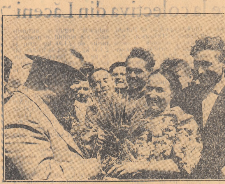
Lucrătorii sovhozului Buruhalsk de pe pămînturile înfălțite din regiunea Cikalov discută cu tov. N. S. Hrușciiov, prim secretar al C.C. al P.C.U.S.

Partidul și guvernul nostru nu au alte interese decît interesele poporului. Ete mobilizate toate forțele noastre, toate posibilitățile noastre materiale și spirituale în slujma de omului, a poporului, a societății. Sub conducerea partidului comunist poporul sovietic va obține succes noi, fără precedent, va merge și de acum înainte pe calea arătată de Lenin: pe calea comunismului.