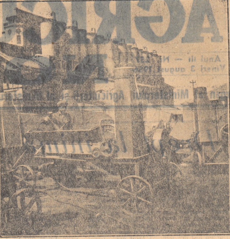
La uzinele „7 Noiembrie” din Craiova, se produc pe lingă alte mașini și unelte agricole, toacătoare de nuret, după tipul sovietic R.S.S.-6. Aceste mașini sînt acționate cu ajutorul unui motor sau tractor și pot toca într-o oră 6 tone de nuret.