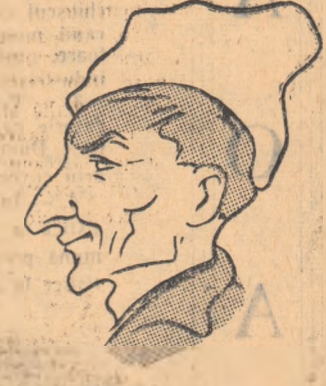
GHEORGHE ION Slănic dansuri rominești