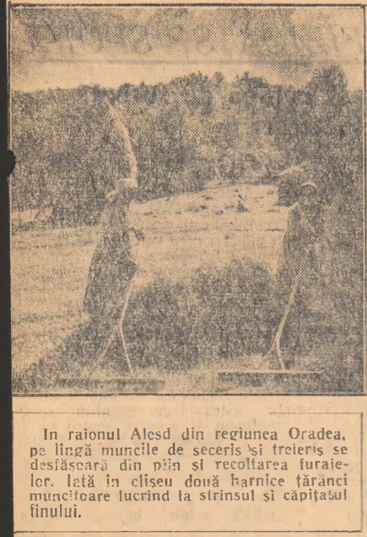
In raionul Alesd din regiunea Oradea, pe lângă muncile de seceris și treieris se desfășoară din plin și recoltarea furajelor. Iată în clipse două hărnicie țărâni muncitori lucrând la strînsul și captivul înului.