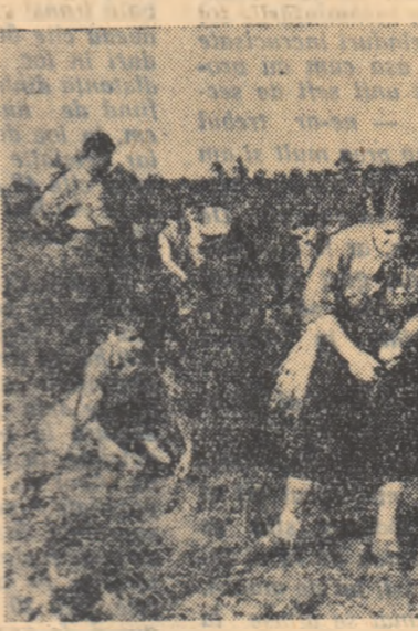
Altoiți și pomi sătuiți în sămânță în pepinieră