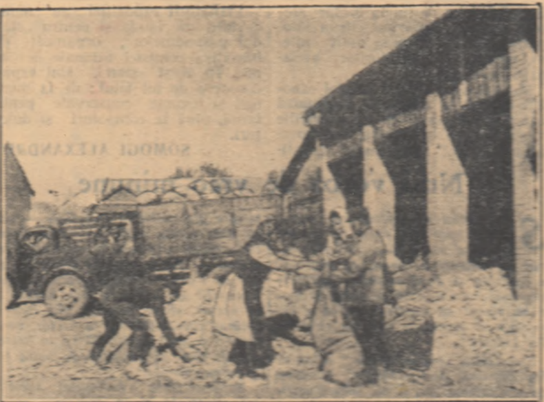
Îndată ce au aflat despre inițiativa colectivizării din Bătră-Oraș, membrii gospodăriei colective din comuna Bătră, aceeași regiune, au hotărît în adunarea generală să vîndă și ei stocul și cantitatea de 50.000 kg de porumb din recolta acestui an.

În fotografie: un grup de colectiviști lucrînd în autocamionul porumbului destinat vînzării către stat.