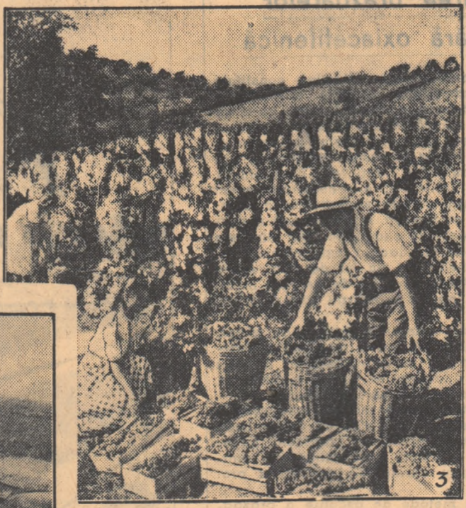
3. Si în Uniunea Sovietică, culesul strugurilor este în toi. In fotografie: membrii colhozului „Kirov” din Ucraina subcarpatică string bogata recoltă de struguri.

In fotografie: recoltarea mecanizată a stecii de zahăr în colhozul „Steaua Rosie” din regiunea Djambul.