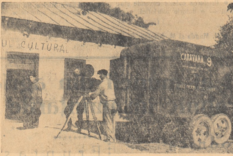
Direcția cinematografică regională Galați a trimis o serie de caravane cinematografice în satele regiunii. În cadrul Lunii prieteniei romino-sovietice, aceste caravane aduc satelor filme sovietice de lung metraj. În fotografie: la câmpul cultural din comuna Traianu a sosit caravana cu filmul sovietic „Căderea emiratului”.