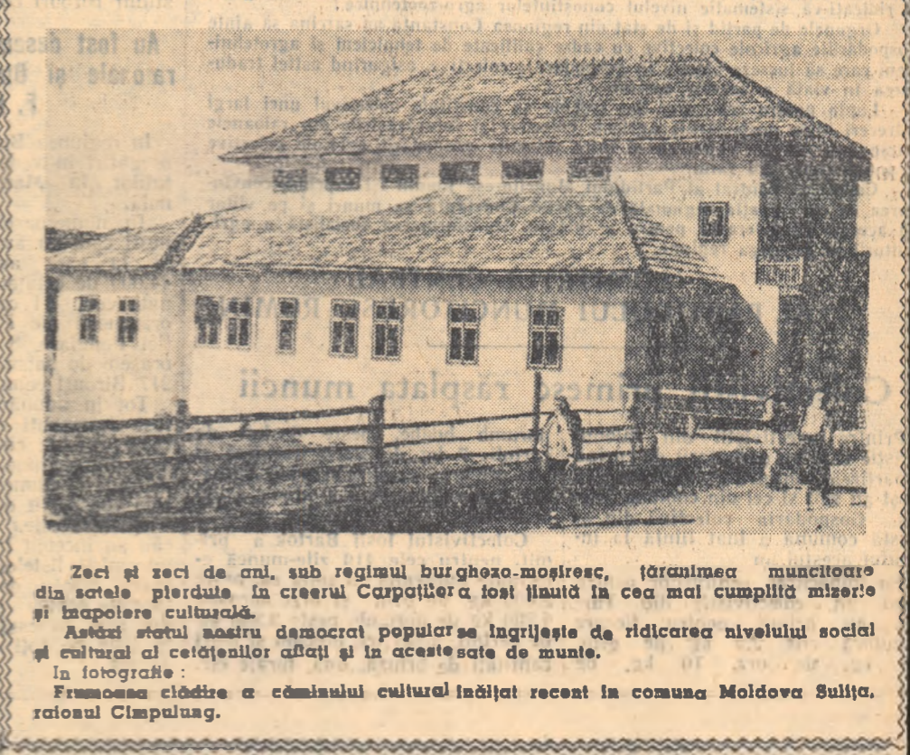
Zeci și zeci de ani, sub regimul burghez-moșieresc, țărănimia muncitoare din satele pierdute în creșterea Căpățînii a fost înaltă în cea mai cumplită mizerie și izolare culturală.

N-a trecut mult timp, și visul ștaturilor de a avea școli în satele lor s-a împlinit. Astăzi, în fiecare din aceste sate este cite o școală frumoasă, cu clase și săli de recreație spațioase. În total, în regiunea Suceava au fost construite în acest an 136 de clădiri noi și 29 de poduri. În afară de acestea, au fost rafinate 8 sate, iar alte 2 au fost electrificate.