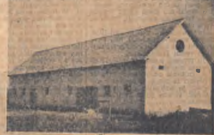
Magazia de cereale a colectivei „Partizanul” din comuna Ernei, raionul Tg. Mureș. (sux.)

Folosind cu pricepere resursele interne, numeroase gospodării agricole colective și-au ridicat în anul ce a trecut noi construcții.