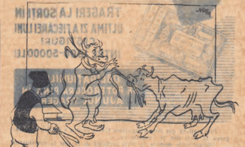
INGRIJITORUL: Stați! Stați! Nu vă bateți, că vă împac eu aceluși pe amlindouă!

În unele gospodării agricole colective s-a aplicat o nouă metodă de furajare a animalelor, care asigură un cost mai mic și o mai bună dezvoltare a acestora.