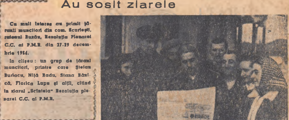
Cu mult interes au primit zlearele muncitorii din com. Scurțeni, raionul Buzău, Rezoluția Plenarei C.C. al P.M.R. din 27-29 decembrie 1956.

Organ al Ministerului Agriculturii și al Ministerului Gospodăriilor Agricole de Stat din R. P. R.