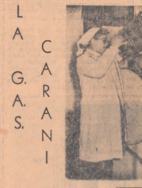
L. A. C. A. S. I.

Încheiere vorbitorului a scos în evidență faptul că activitatea științifică pe anul 1956 cuprinde