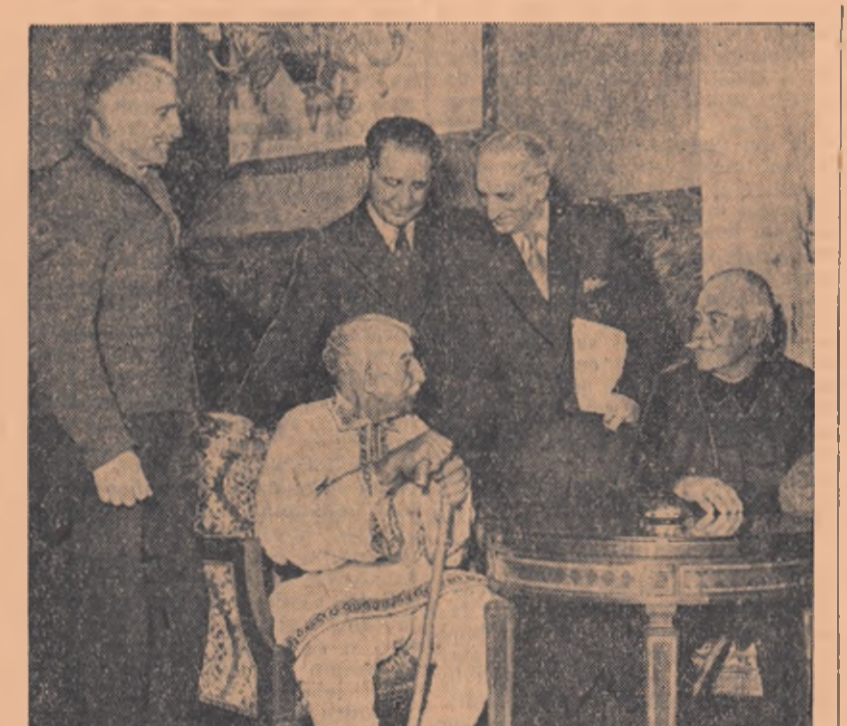
Tovarășul Gheorghe Apostol întreținîndu-se cu clișiva țărani care au luat parte la răscoala din 1907.

Miercuri după amiază, la Consiliul de Miniștri a avut loc constituirea Comitetului Național de organizare a celei de a 50-a aniversări a răscoalelor țărănești din 1907, potrivit hotărîrii C.C. al P.M.R. și Consiliului de Miniștri. Deschizînd adunarea, tovarășul Chivu Stoica, președintele Consiliului de Miniștri, a arătat că marile răscoale țărănești împotriva jugului burghezo-moșieresc, pentru pînă, pămînt și libertate, reprezintă o pagină glorioasă în istoria poporului și a mișcării revoluționare din țara noastră. Vorbitorul a amintit cu cîtă cruzime au fost reprimare răscoalele de către burghezii și moșierii și a subliniat sprijinul pe care mișcarea muncitorească l-a acordat țărănilor răscolai. După ce a vorbit despre însemnătatea internațională a răscoalelor din 1907, tov. Chivu Stoica a spus: Idealurile pentru care au singurat țărani din 1907 s-au re-