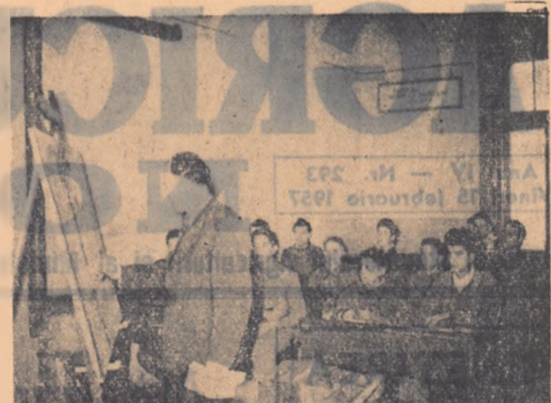
Pe lângă S.M.T. Orșioara funcționează și anul acesta o școală de ucenici mecanici...