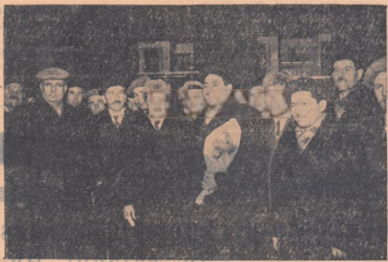
Delegația bulgară fotografată în Gara de Nord la coborrea din tren.

Sună telefonul... Răspunde un coleg. „Cum? Oaspeți din Bulgaria? Peste 25 de minute în Gara de Nord?” Trebuie să plec. Astăzi sînt, ca să zic așa, reporter de servici. De ar veni mai repede troleibuzul... De nu ar sta pe la stourii... M-am temut degeaba. Troleibuzul a venit imediat. Cînd am intrat pe peron crăncinul gării anunță: „Peste 2 minute intră în gară, pe linia întâia, acceleratul de Sofia”. Am ajuns la timp. Sînt un reporter norocos.