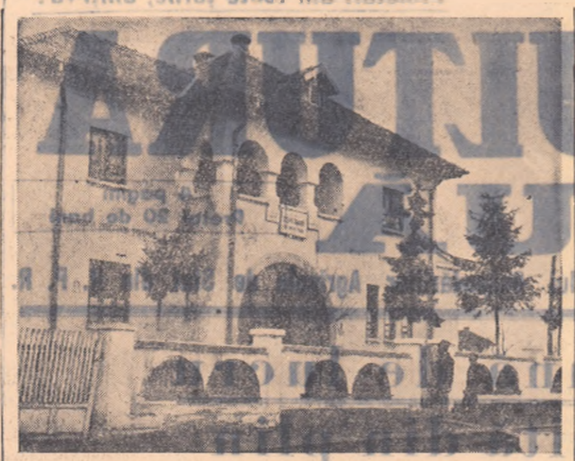
O nouă mîntuire a școlii lață de sămăntoase omului. Disparatul de curiază coasit în comuna Giugiova, regiunea Căsoava, va ajîta la lăcătarea bolilor și a sferărilor.