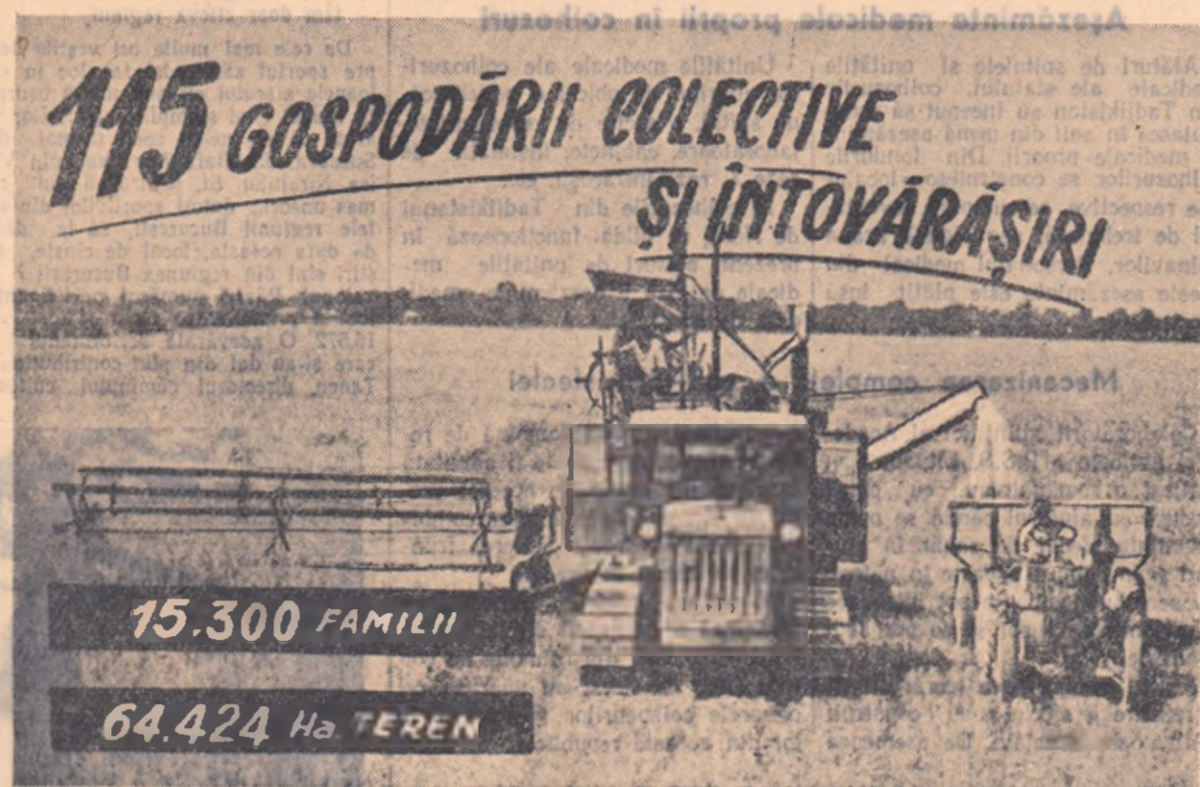
Cele 15.300 de familii de țărani muncitori din raionul Brăila, unite în 115 gospodării colective și întovărășiri agricole, stăpânesc la totalitate 64.424 de hectare teren.

La cooperativizarea agriculturii din raionul Brăila, o contribuție însemnată au adus și unitățile culturale. Organizând o activitate bogată, interesantă și plină de conținut, angrenând în muncă un larg act de colaboratori, căminele culturale din raion au ajutat la îndrumarea țăranilor muncitori pe drumul transformării socialiste a agriculturii.