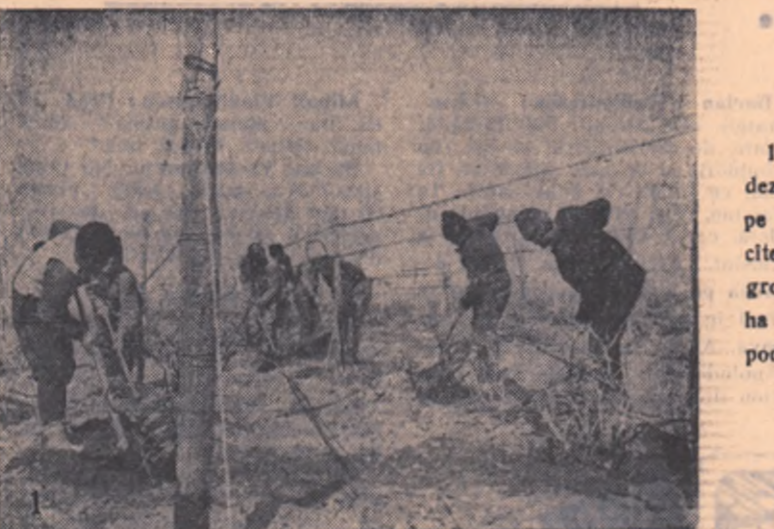
1) Ultimele lucrări de dezgropare a viei sînt pe terminate. Numai în câteva zile au fost dezgropate aproape 400 de ha pe care le are gospodăria.