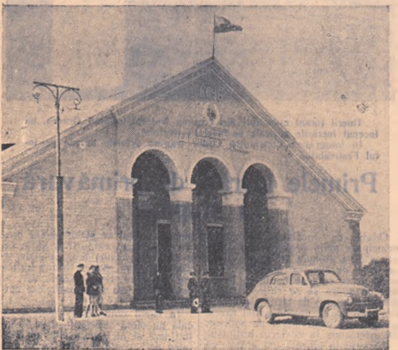
Noul club al colhozului „Ucraina Sovietică” din regiunea Stalino, R.S.S. Ucraineană.

Șanov, președintele Consiliului de Miniștri al R.S.F.S.R., ministrul al U.R.S.S. și alte persoane oficiale. În cinstea delegației guvernamentale a Ungariei se aeroport a fost ținută o gară de onoare; au fost ținute înmurmure de stat ale Republicii Populare Ungare și Uniunii Sovietice. Oaspeții au fost salutați de N. A. Bulganin, președintele Consiliului de Miniștri al U.R.S.S. A răspuns János Kádár, șeful guvernului ungur.