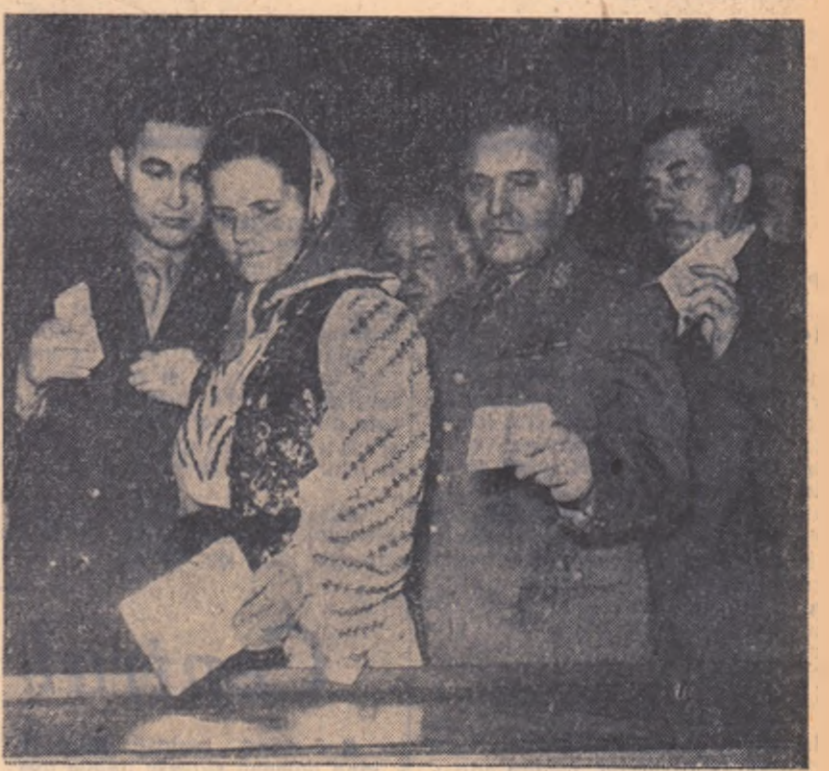
Un grup de deputați votînd

Sedința din după-amiază zilei de marți a fost consacrată Declarației asupra politicii interne și externe a guvernului Republicii Populare Romîne.