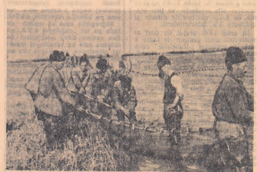
La cooperativa de producție agricolă cu rentă din comuna Pietroșani, regiunea București, a fost organizată și o brigadă piscicolă. În fotografie: cîteva din membrii acestei brigăzi stingînd năvoadele în timpul pescuitului.