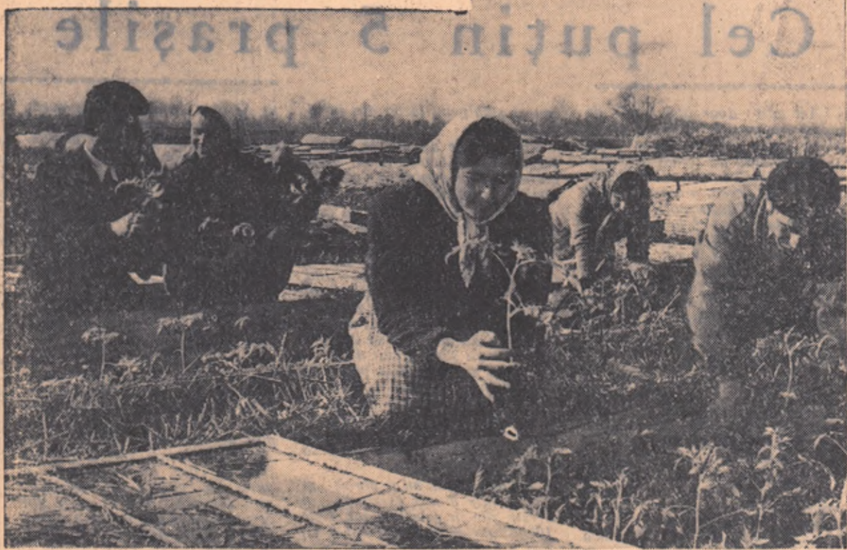
In gospodariile agricole cooperative de muncă din R.P. Bulgaria, le gemicultura a luat o puternică dezvoltare...