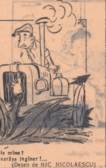
— Hei, nepreț! Eraj să dai peste mine! — Tii! Nicl nu v-am observat, tovarășe inginer!... (Desen de NIC. NICOLAESCU)

Inginerul agronom Arbore de la secția agricolă a raionului Focșani a hotărît „pe răspunderea sa” ca tractoriștii de la S.M.T. Florești să semene — fără oroa altă lucrare prealabilă — porumb hibrid pe lotul zootehnic al stațiunii raionale, care era pînă cu bădări.