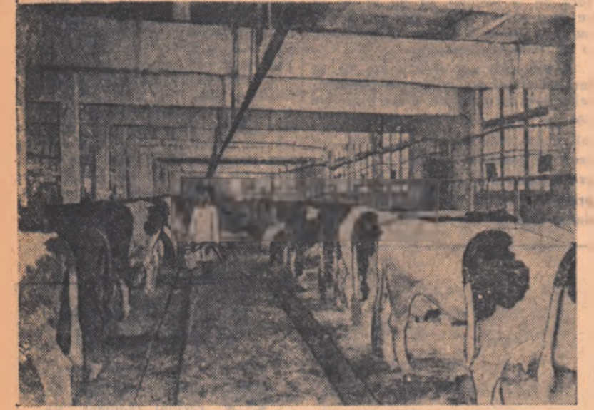
Grajdul de vaci este curat, încăpător și luminos. Mulsul se execută cu aparate electrice.

raionul Mitiscel. La această fermă, vacile din vechea rasă rusească Holmogorskala au dat anul trecut în millociu cîte 3.500 kg. de lapte.