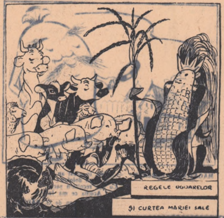
(Desen de V. GRIGOREEV din revista „Krokodil”)

Nu există cultură care se poate asemui cu porumbul. De aceea i se spune porumbului, regele ogoarelor.