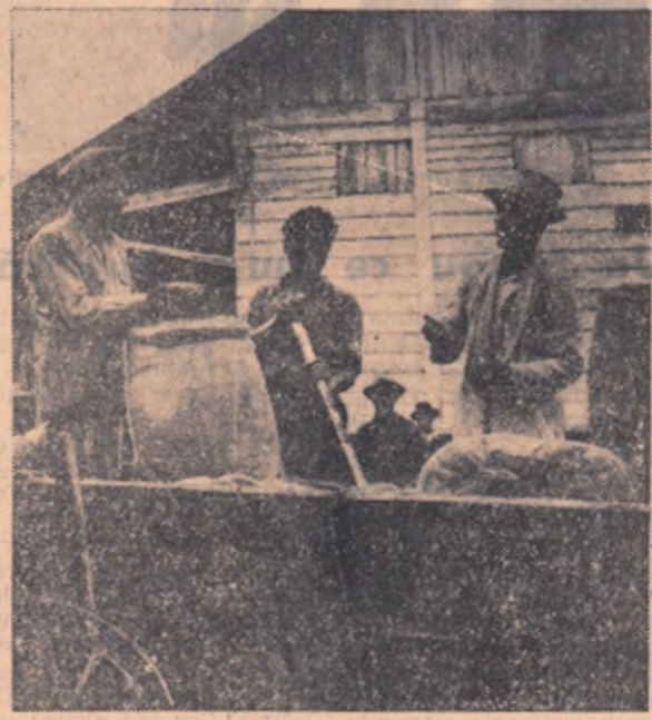
La baza de recepție din Căracal tosește zilnic mari cantități de grîu contractate cu statul.