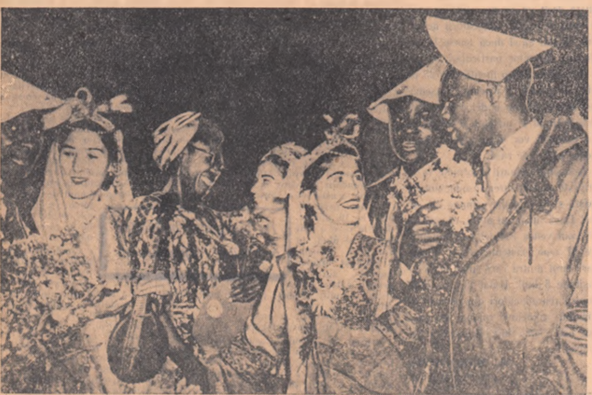
La cel de-al VI-lea Festival Mondial al Tineretului și Studenților de la Moscova se întâlnesc tineri din toate colțurile lumii. În clișeu: O seară de solidaritate cu tineretul din țările coloniale. Delegații Nigeriei, Sierra-Leone, Gambia și Gambia, discutând cu o tânără din R.S.S. Tadjică.