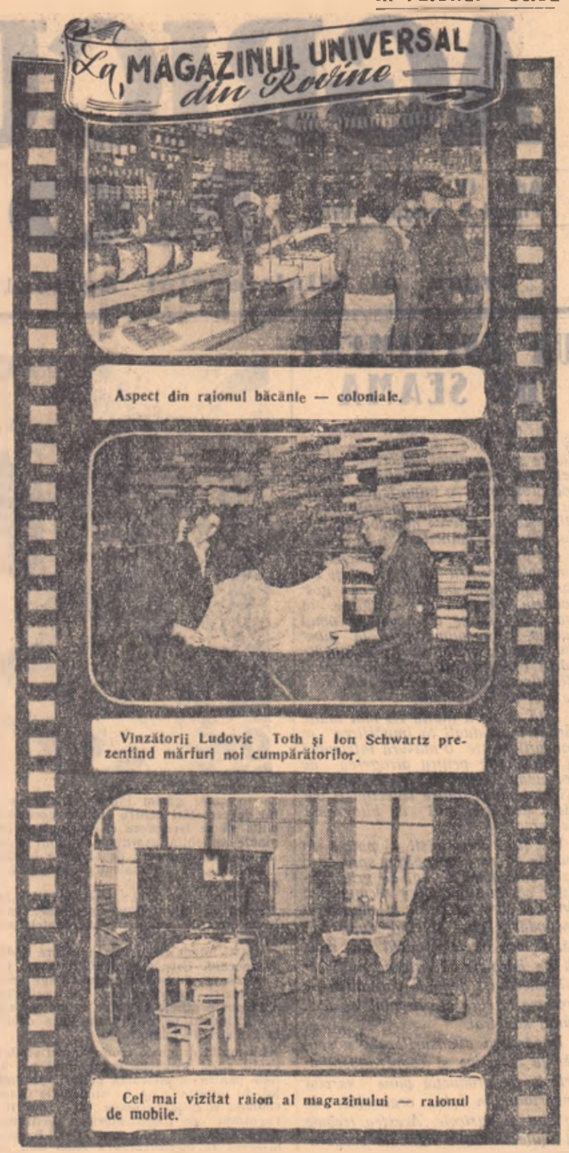
Fotoreportaj de S. PICKER și N. SCARLET