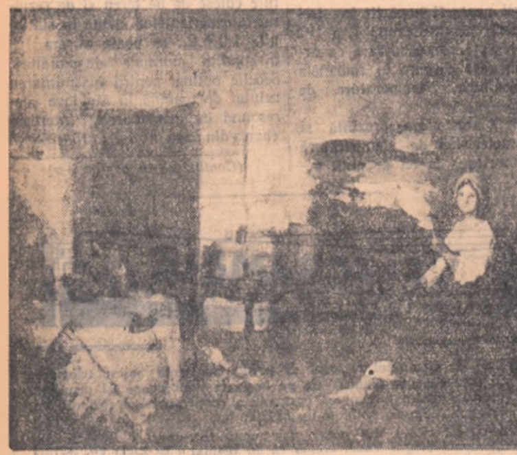
N. GRIGORESCU: Tărăncă în interior