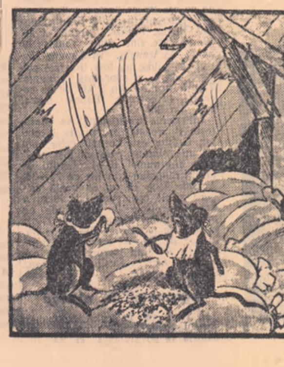
Desen de G. BADEA

— Toamnă, nea Mielus, toamnă... Vremea trecea încet, ce e drept, mai încet decât se gândește vinul din sticle... În una locuri hambare pentru adaptarea grinzilor n-au fost reparate la timp.