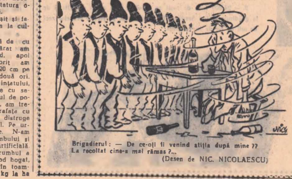
Brigadierul: — De ce-ți fi venit altăia după mine??