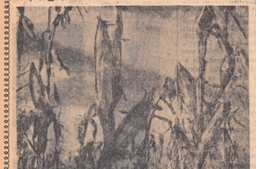
Scena din „Porumbul hibrid”