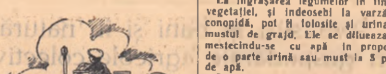
Scena din „Porumbul hibrid”