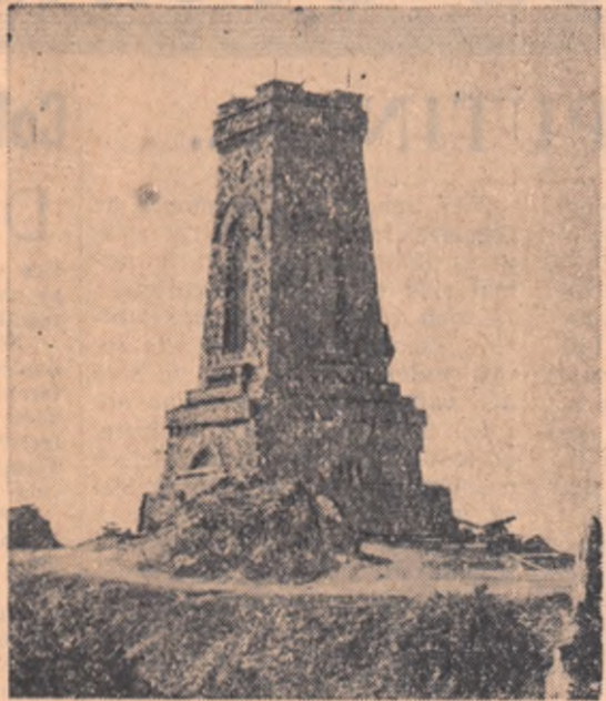
Monumentul eroilor de la Șipca

Cu prilejul unei vizite pe care am făcut-o de curând în R.P. Bulgaria, am vizitat și locul istoric Șipca. În acele zile, poporul bulgar făcea mari pregătiri pentru sărbătorirea eroicelor lupte ce s-au dat aici. Am urcat cu adâncă emoție cele 1.004 trepte de piatră care duc la culmea pe care se înalță monumentul impunător. Pe una din plăcile de bronz, se pot citi aceste cuvinte răscolitoare: „Bulgari! Descoperiți-le și aşezările cu aviația în genunchi în acest loc sfânt! Aici, de la 7 Iulie la 28 decembrie 1877, armatele rusești și voluntarii