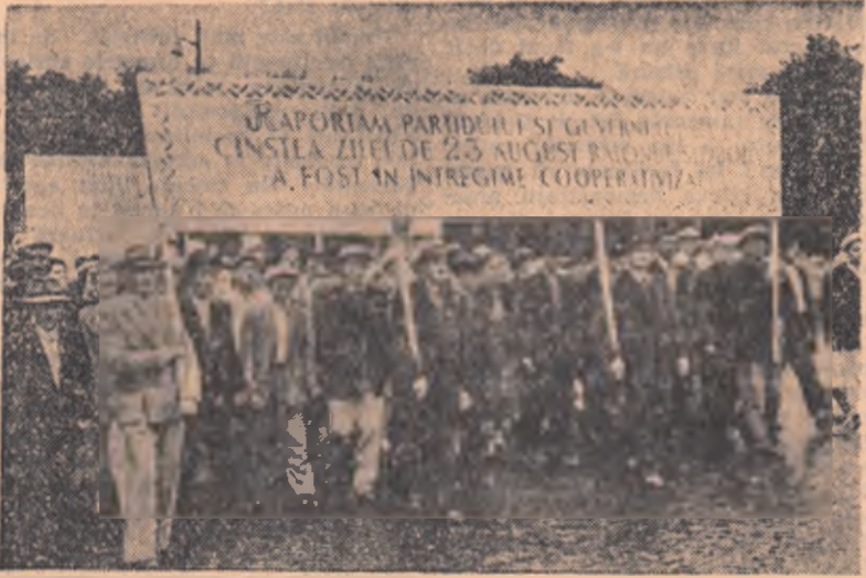
Un succes cu care el se mîndrește: cooperativizarea agriculturii întregului raion Slobozia.

Încă din primele ore ale dimineții zece și zece de mii de cetățeni ai capitalei s-au reunit ca un suflet, pe arterele principale ale orașului pentru a se îndrepta spre Piața Sialini, unde urmează să aibă loc demonstrația.