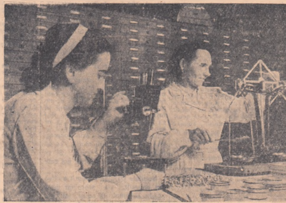
Oamenii muncii de pe ogoarele regiunii Cluj s-au convins din proprie experiență că pe lângă celelalte măsuri agrotehnice, dobîndirea unei recolte bogate la hectar este chezură în cea mai mare măsură de folosirea unor semințe de soi glie bună calitate. De aceea, la laboratorul regional Cluj se face în această perioadă analiza a mil și mil de probe de semințe trimise din toate raioanele.

În fotografie: două dintre tehnicenele laboratorului lucrînd la analiza semințelor de grâu.