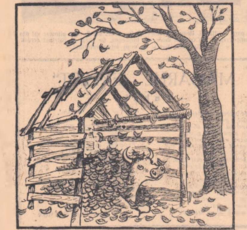
...și mă mai plîngeam de adăpost!

La gospodăria colectivă din satul Castieni, comuna Ioița, raionul R. Sărat, nu se dă atenție pregătirii adăposturilor pentru animale.