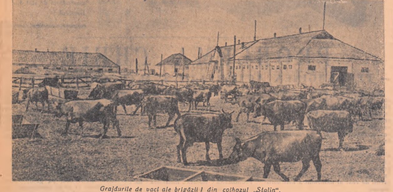
Grajdurile de vaci ale brigăzii I din colhozul „Stalin”.

și cu boaroana de lemn. Caracteristic starea țăranilor din părțile Dnepropetrovskului de la sfîrșitul veacului trecut, V. I. Lenin scria in una din lucrările sale ca o mare parte din gospodăriile țărănești nu pot lucra pământul cu propriile lor mijloace de tracțiune. In prezent, colhozurile din raionul Ghencioșki sînt deservite de patru stațiuni de mașini și tractoare.