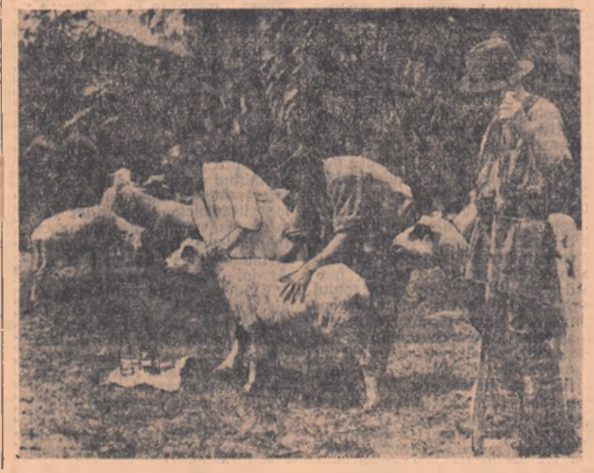
Oamenii din Vama, raionul Suceava, au pus întovărășiri lor zootehnice numele „Miorița” și în ultimii doi ani, de pildă, producția medie de grâu la hectar a fost de 3.000 kg.