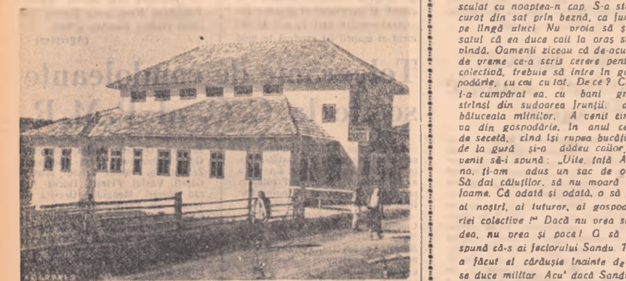
In mijlocul comunei Moldova-Sulița, din raionul Cîmpulung, se înălță frumoasa clădire a cîmînului cultural. (fotografia de mai sus). Această realizare cu care se mîndrește țărani muncitori din comuna Moldova-Sulița a fost întăpluită prin autimpunere.