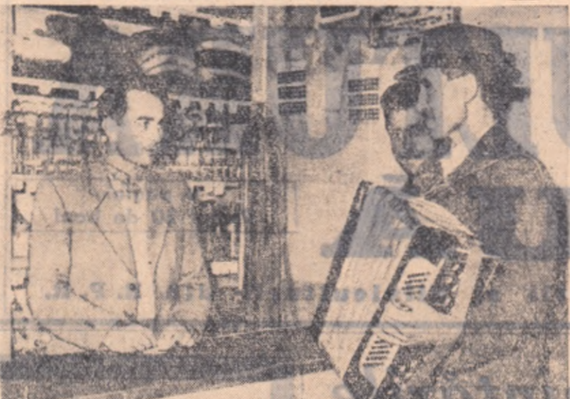
Colectivul Bella Biro din Sărăteni a trecut pe la magazinul co- operativ din Savata raională. Tg. Mureș și „Incearcă” un acordon. „Mi place și-l cumpăr, dar mai aștept câteva zile pînă se îm- pară veniturile la gospodăria noastră colectivă”, i-a spus el gestionariul.