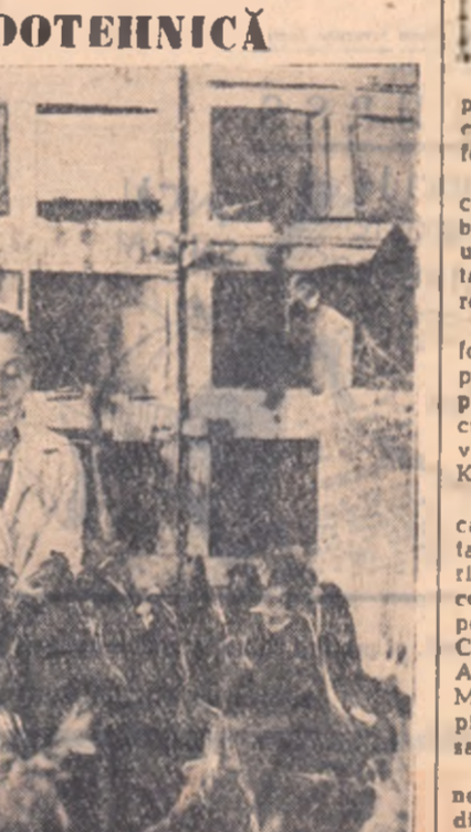
LA FERMA ZOOTEHNICA