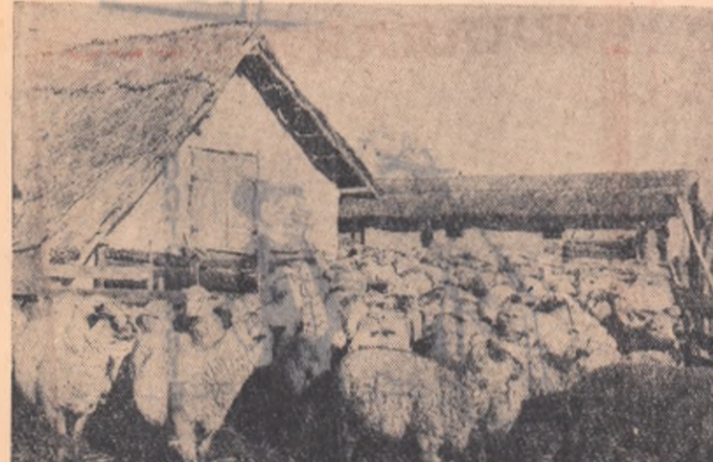
Creșterea oilor este o îndelungată lăcomie. De acest lucru s-au convins și membrii gospodăriei agricole colective „Prietenia romino-albaneză” din raionul Ottenia, care de curînd și-au mai cumpărat cîteva zeci de oi pentru a-și completa o turmă de 400 de capete.