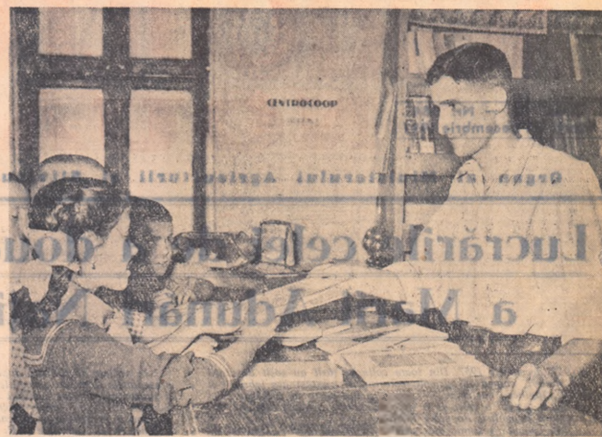
În anii regimului de democrație populară, cartea a pătruns tot mai adînc în masele largi de cititori din patria noastră. În largă rețea de biblioteci și librării răspîndite în toată țara, cititorii de toate vîrstele pot găsi cărți pe placul lor. În fotografie: gestionarul librării din comuna Comana, raionul Vidra, regiunea București, vînzînd cărți școlare.