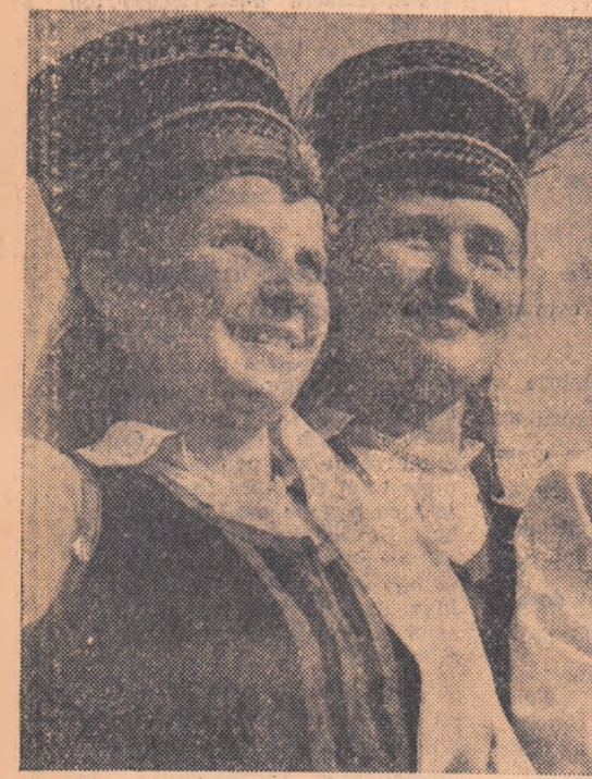
Tărăncuțe din regiunea Kurpie, în frumosul lor port național.