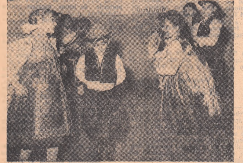
Căminul cultural din comuna Vinga, regiunea Timișoara, are și o echipă de dansuri alcătuită din copii. Îmbrăcați în frumoase și pitorești costume naționale, așa cum îi vedem în fotografia de față, micii dansatori sînt mult aplaudați de spectatori.

— Dacă ai mîncat, ce mai aștepti aici? — Să apuc sînd pentru masa de seară! Desen de NIC. NICOLAESCU