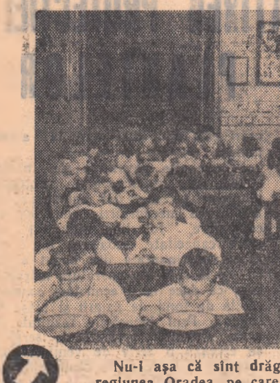
Nu-i așa că sînt drăgălași copiii colectivștilor din Sintana, regiunea Oradea, pe care fotoreporterul nostru i-a surprins la creșa taman la ora prînzului?