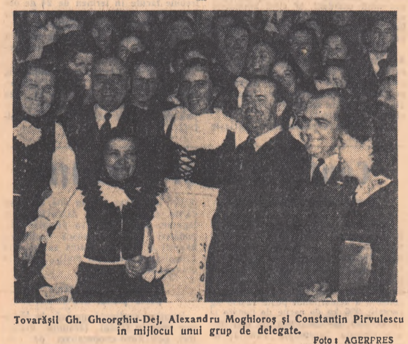
Tovarășii Gh. Gheorghiu-Dej, Alexandru Moghioroș și Constantin Pirvulescu în mijlocul unui grup de delegate.