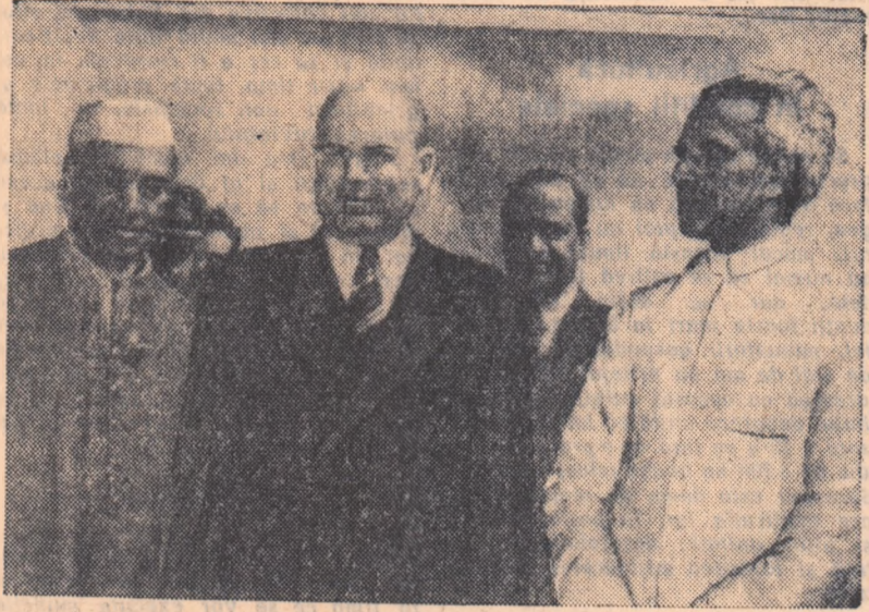
Jawaharlal Nehru, Chivu Stoica și Krishna Menon pe aeroportul din New-Delhi

Luând parte la discuție vor contribui la generalizarea experienței înaintate, la promovarea formelor organizatorice ce se dovedesc în start să ajute la continua întărire a gospodăriilor și cooperativei de producție.