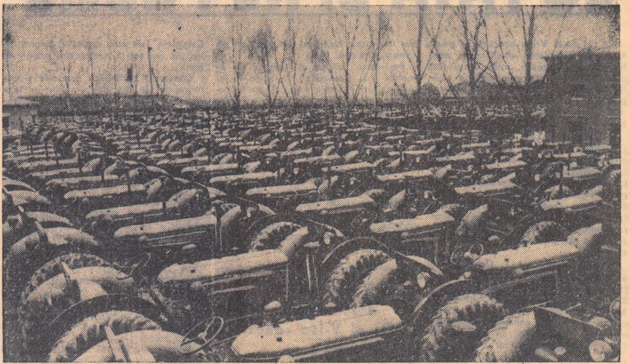
Vrednicii constructori de la Uzinele de tractoare „Ernst Thälman” din Orașul Stalin au pregătit încă un lot de câteva sute de tractoare U.T.O.S.-26 pe cauciucuri. În clișeu-noul lot de tractoare este gata de a porni spre ogoare.