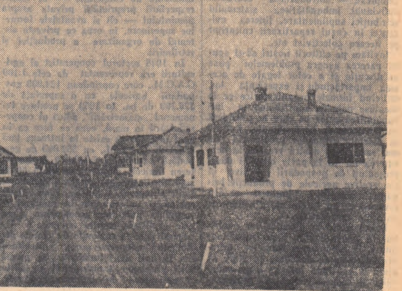
Mecanizatorii de la S.M.T. Urziceni, regiunea București, au primit în cursul anului 1957 încă 10 apartamente pentru familiile.

Față de situația existentă în această gospodărie, este cu totul inexplicabilă atitudinea secției agricole și a celorlalte organe raionale, care se mulțumesc să constate că gospodăria merge slab, dar nu se preocupă de îndrumarea mai atentă a ei. Printre vrăteni se găseesc mulți oameni inimoși și harnici. Insuși președintele e unul dintre ei. Dar îi lipsește îndrumarea tehnicienilor. Cînd o va avea gospodăria va ajunge repede la nivelul unităților fruntașe, din Grăuța, Pîștel și alte sate, iar colectivștii nu vor mai fi nevoiți să aștepte primul avans bănesc tocmai în luna iunie.