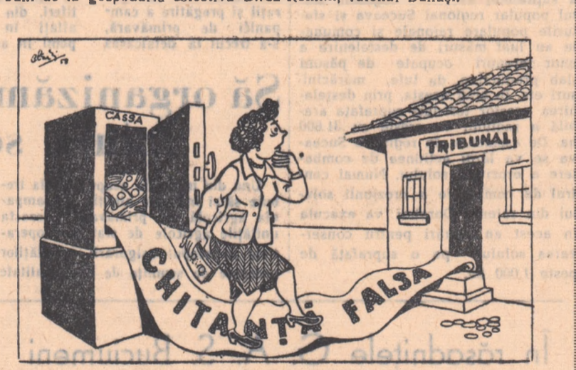
Povestea fără cuvinte a unei chitanțe false

Contabila Jdele Profira folosindu-se de o chitanță falsă a sustras bani de la gospodăria colectivă Bircu-Romîni, raionul Buhuși.