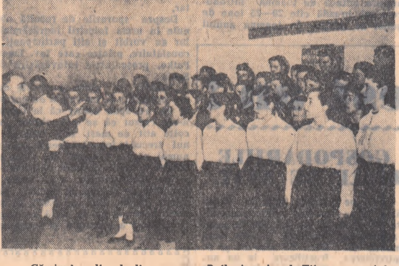
Căminul cultural din comuna Potlogi, raionul Titu, are, printre formațiile sale artistice, și un cor mixt, mult apreciat de țărâni muncitori din comună. În fotografie: corul din Potlogi pe scena căminului cultural.