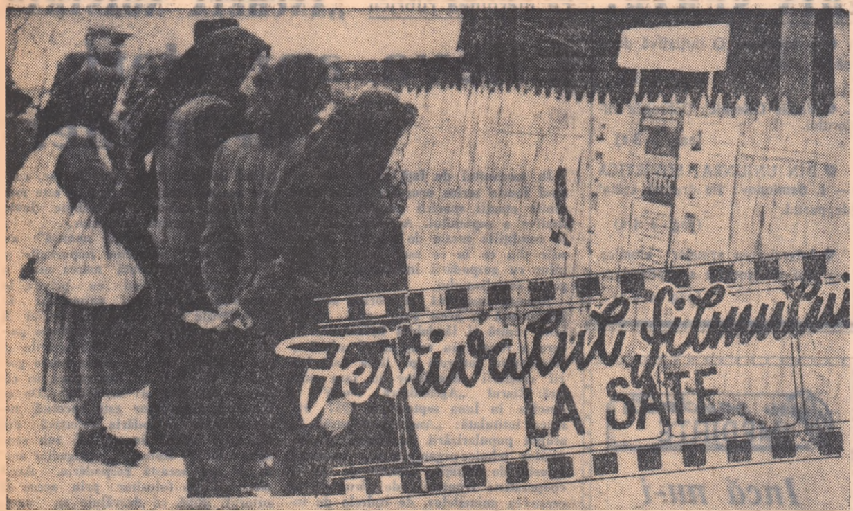
Cinematograf în Valea Ierii. Nerăbdători, spectatorii citeșc programul din seara respectivă.