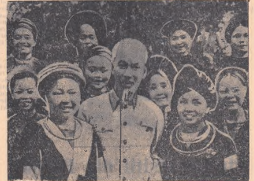
Președintele Ho Și Min, în mijlocul elevilor Școlii Naționalităților.