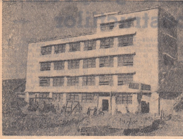
La HANOI a intrat in functiune, in luna decembrie 1957, o noua fabrica de decorticat orez. Capacitatea de productie a noii intreprinderi este de 200 tone orez decorticat pe zi.