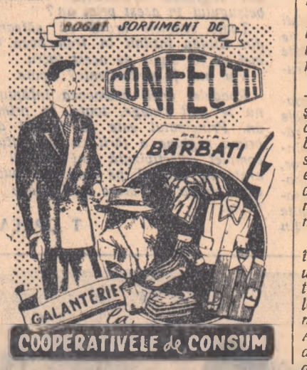
COOPERATIVELE DE CONSUM

— Și am cumpărat juncanii; le-am pus asternut curat și le-am pregătit de mîncare, cum făceau tu pentru boii cei mari.