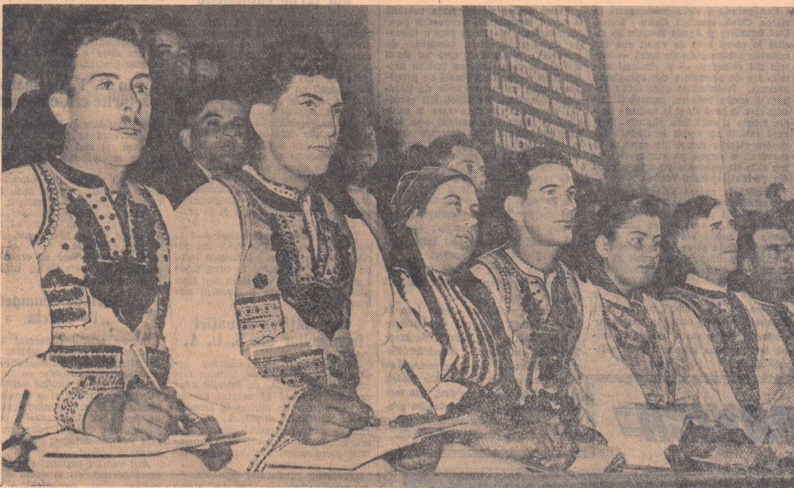
Un grup de țărani din regiunea Stalin urmărește cu atenție desfășurarea lucrărilor Consiliului.