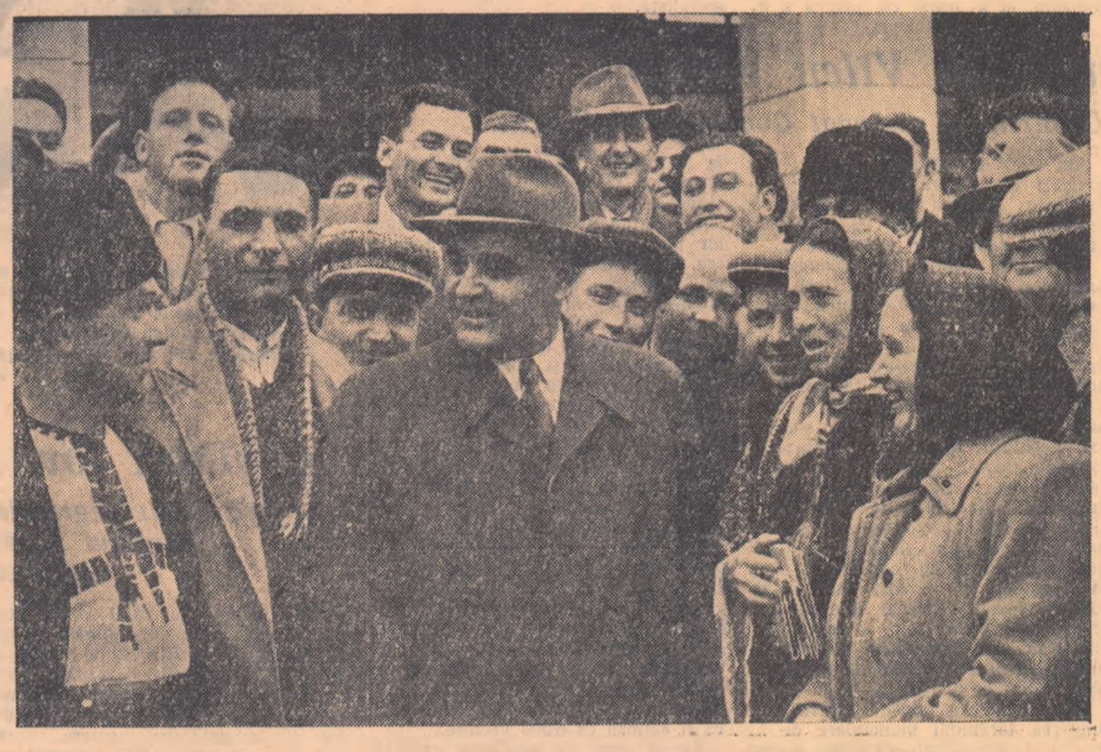
În Vija Palatului Sporturilor, după încheierea lucrărilor, ... și acum, tovarășii, drum bun și spor la muncă!