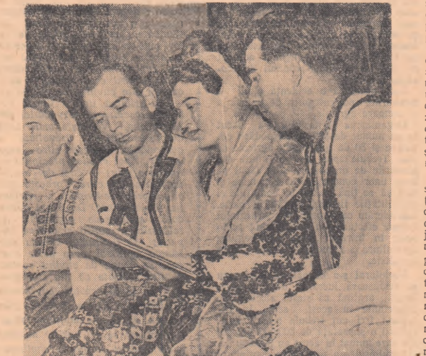
Discuțiile sînt deosebit de interesante. Invățăminte prețioase pot trage și acești colectiviști din regiunea Pitești care nu vor să piardă nici un cuvînt din cele ce se rostesc aici.

Analiza felului în care au fost executate lucrările la cîmp se face la fiecare 10 zile. La aceste ședințe iau parte șefii de brigadă, pontonierii, mecanicii de sector și inginerii agronomi din gospodăriile agricole colective. Datorită mai bunei organizări a muncii și controlului asupra activității brigăzilor în cîmp, sarcina de plan executată de fiecare tractorist a crescut simțitor. Dacă în anul 1955 s-au realizat 310 ha arătură normală pe