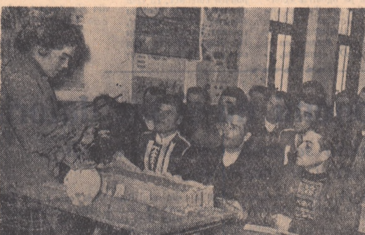
La gospodăria agricolă colectivă „Olga Bancic” din comuna Coșereni, raionul Urziceni, s-au ținut în acest an cu multă regularitate cursurile agrozootehnice. Iar ca a luat parte un mare număr de țăranii muncitori din comună. În fotografie: un aspect de la o oră de curs.