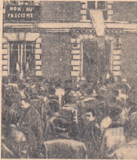
O manifestație de protest a oamenilor muncii din Partidul împotriva uneltirilor fasciștilor din Algeria.

despre reorganizarea stațiilor de mașini și tractoare? Noi sprijinim din toată inima această măsură a partidului și guvernului. Uităi-vă, vedeti cîo în cîmp un tractor cu o remorcă după el? Acum tractorul acesta e al nostru și nu stă nici o clipă fără treabă. Așa era oare și înainte?” Am stat de vorbă și cu alți colhozici. Și ei aprobă cu căldură noua lege. Colhozicii din Letonia Sovietică știu bine că reorganizarea stațiilor de mașini și tractoare înseamnă încă un pas pe drumul întăririi și dezvoltării continue a orînduirii colhoznice.