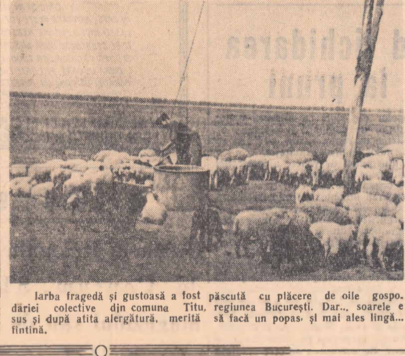
larba fragedă și gustoasă a fost păscută cu plăcere de oile gospodăriei colective din comuna Titu, sus și după alită alergătură, merită fîntîna.