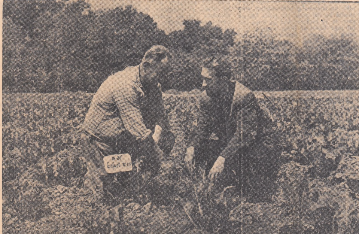
În vederea creării a noi soiuri de legume mai productive adaptate condițiilor țării noastre stațiunile experimentale agricole sînt chemate să aducă o contribuție de seamă.

Stropitul se va face cu zeamă bordeleză în concentrație de 0,5 la sută. Pentru aplicarea restului de stropiri sfătuiți pe podgoreni să fînă o strînsă legătură cu stațiunile de avvertizarea manei.