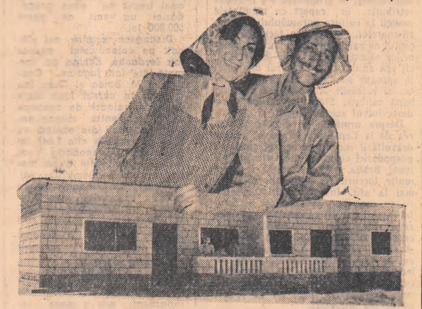
Acești felahi săraci au astăzi pămînt și casă, acordate de stat la El Tahir — Regiunea Eliberării.

popoarelor de către imperialiști. Pe acest soclu va fi înălțată statuia adevăratului stăpîn al canalului: chipul monumental al felahului — jefarul egiptean — care l-a săpat cu țara a 120.000 de morți. Orașul nou, statuia uriașă, a țării și poporului eliberat din sclavia colonialistă. La 23 iulie 1952 — ziua revoluției egiptene, ziua scuturării jugului purtat aproape cinci secole. Revoluția a adus poporului abolirea formelor imperialiste a feudalității monopolurilor capitalurilor străine, o justiție socială, o armată pentru apăra-