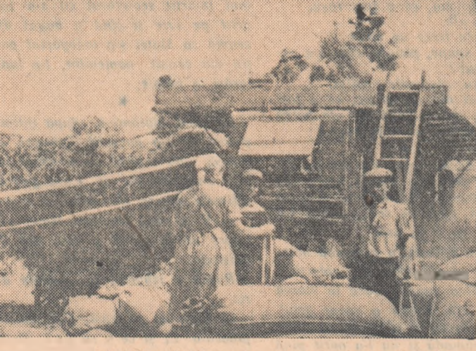
La aria electricată din comuna Sinpetru, raionul Codlea, membrii gospodăriei colective „8 Mai” sînt cu treieratul grîului pe sfîrșite. Mulțumită sprijinului dat de S.M.T. Hărman, colectivității de aici au obținut o recoltă medie de peste 2.000 kg. grîu la hectar.