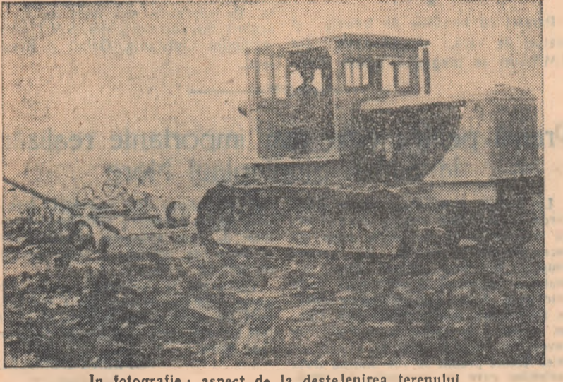
În fotografie: aspect de la desțelenirea terenului

MIHAIL CHELER directorul gospodăriei agricole de stat Cocargeaua, raionul Fetuști