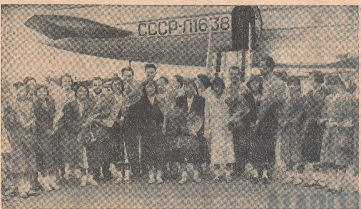
„Orhideele” la sosirea pe aeroportul Băneasa.