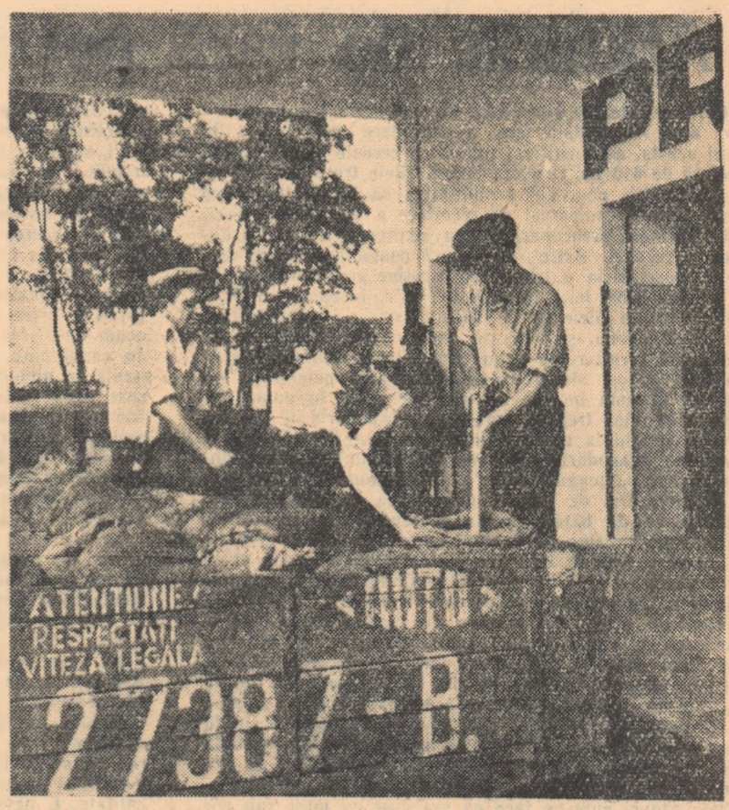
La baza de recepție din Urziceni sosesc zilnic zece de tone de grîu. În fotografie: A sosit un nou transport de grîu de la gospodăria agricolă de stat Borănești.

La S.M.T. Siniccolaul Mare se acordă o deosebită atenție popularizării frunțașilor și metodelor bune de lucru folosite de aceștia. În același timp au fost luate măsuri pentru stimularea materială a celor mai buni tractoriști. S-au cumpărat unele obiecte folosite de tractoriștii cum sînt: un aparat de radio, o bicicletă, un covor, un patefon, cutii de șah și altele. Aceste premii se vor înmîna tractoriștilor care în campania de recoltare vor obține cele mai bune rezultate, în ce privește: realizarea sarcinilor de plan, economii de carburanți și piese de schimb și s-au dovedit disciplinajii în muncă. Chemarea la întrecere pentru cîștigarea premiilor de mai sus a fost primită cu o deosebită bucurie de către toți mecanizatorii S.M.T.-ului Siniccolaul Mare. OPREAN DUMITRU corespondent