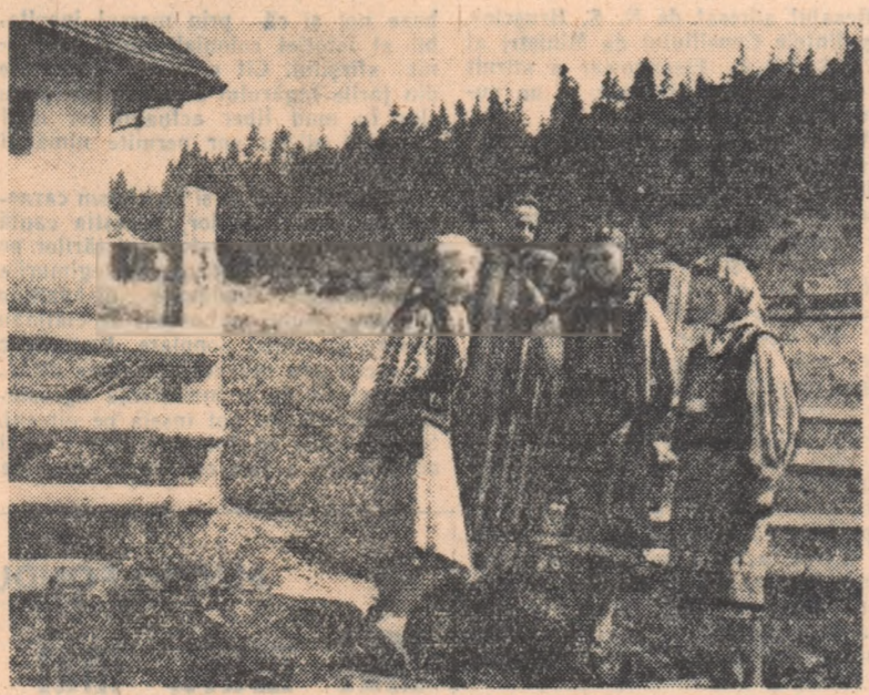
Înainte de a pleca la căminul cultural, un grup de tinere din comuna Gruba, raionul Ineu, regiunea Oradea, s-au oprit o clipă la sfat, în poarta casei.