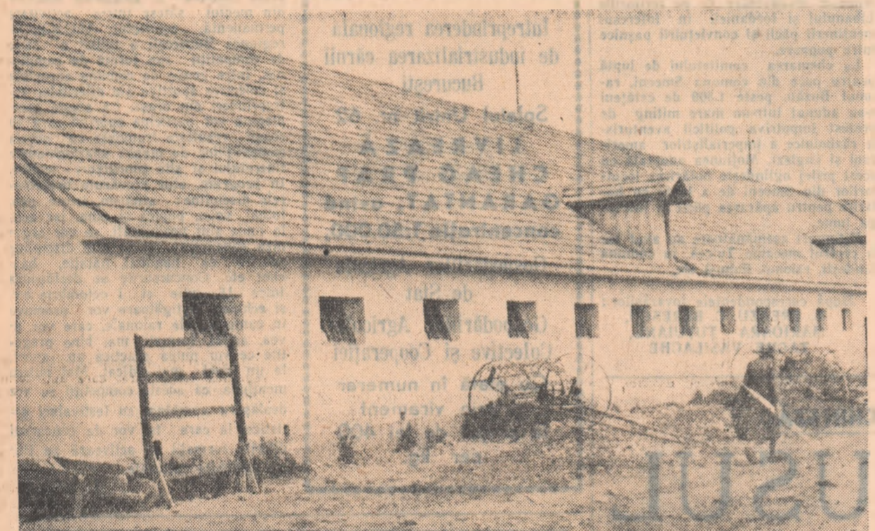
Gospodăria colectivă „Drum Nou” din comuna Cristian, regiunea Stalin, are un fond de bază de peste două milioane lei. Grajdul din fotografia de mai sus, cu o capacitate de 147 vite mari și 30 tineri — electricizat și înzestrat cu adăpătoare automate — mărturisește grija pe care colectivii o poartă dezvoltării sectorului zootehnic.